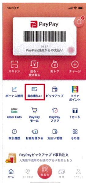
1. アプリのホーム画面にある「請求書払い」をタップ