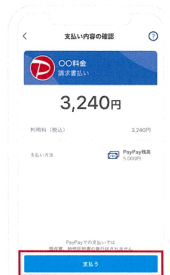
3. 支払金額及び内容を確認し「支払う」をタップ